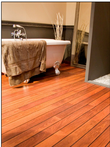
UF 1032 Merbau, lodní paluba