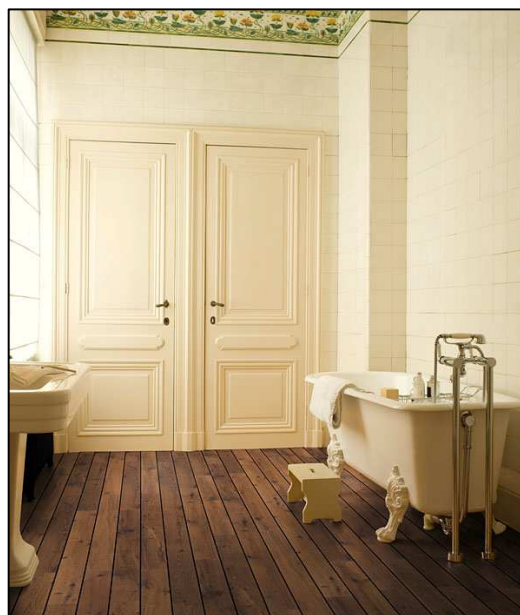
UR 1035 Výběrový dub tmavě lakovaný, lodní paluba