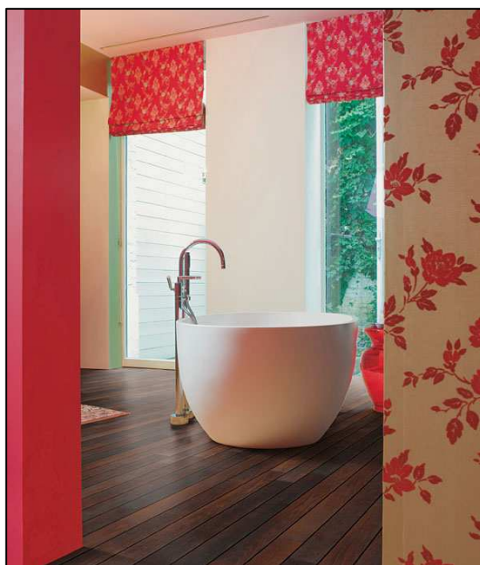
UR 1225 Černý lakovaný palisandr, lodní paluba