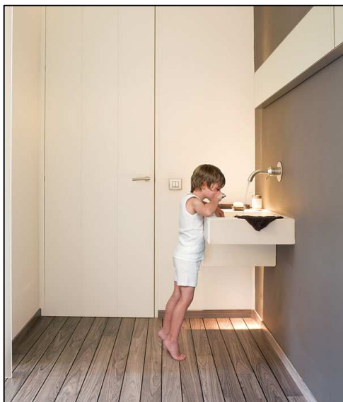
UR 1205 Šedý týk, lodní paluba

Po úspěšném uvedení dvou designů Lagune na trh v roce 2007 se firma Quick-Step rozhodla přidat tři další designy. K dispozici je tak následujících pět designů Lagune: